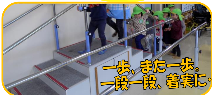
一步、また一步。 一段一段、着実に…。