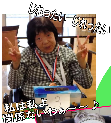
じれったい じれったい 私は私よ 関係ないわあ～～♪

2月16日のカラオケクラブで、第3回カラオケ大会を行いました。それぞれ得意の好きな曲を選択し、採点機能で点数を競いました。広々した食堂ホールで歌うカラオケは気持ち良いこと間違いなし。歌うのも聞くのも、歌って本当にいいものですよ～。景品を獲得した入賞者はご覧のとおりです♪おめでとうございます！