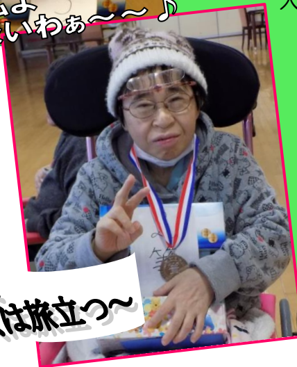
恋人よ ぼくは旅立つ～