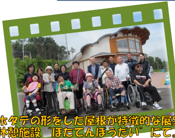
ホタテの形をした屋根が特徴的な展望休憩施設「ほたてんぼうだい」にて。

7月19日(水)。久慈市の隣、野田村に出掛けました。展望台・涼海の丘ワイナリー・のだ塩工房を見学した後、えぼし荘で昼食をいただきました。