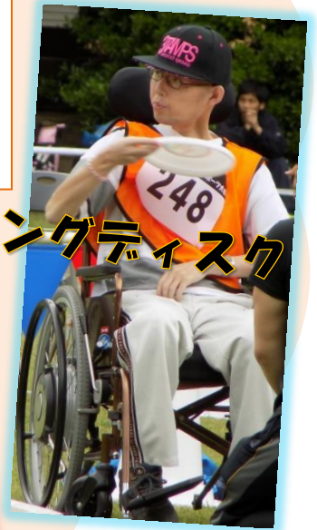
フライングディスク