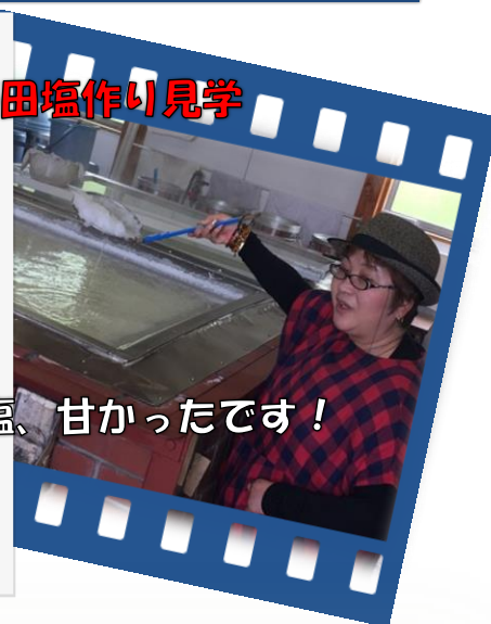
これは、しょっぱ～い(>_<)