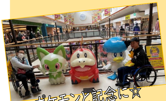
ポケモンと記念に☆

参加された9名の利用者の方々 は、久しぶりのイオンに目を輝 かせ、買い物を楽しまれたり、 お食事を堪能したり、家族へ お土産を熱心に選んだり。それ ぞれ有意義に楽しい時間を過ご していただけたかと思えます。 また、三陸復興道路を初めて通 る方もおられ、その利便性の高 さに驚かれていました。 また一緒に出かけましょうね☆