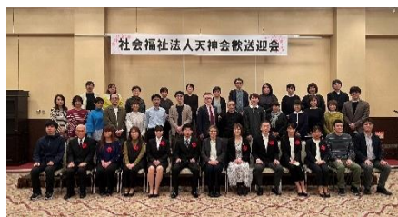
保育園と合同で歓迎迎会を行いました☆