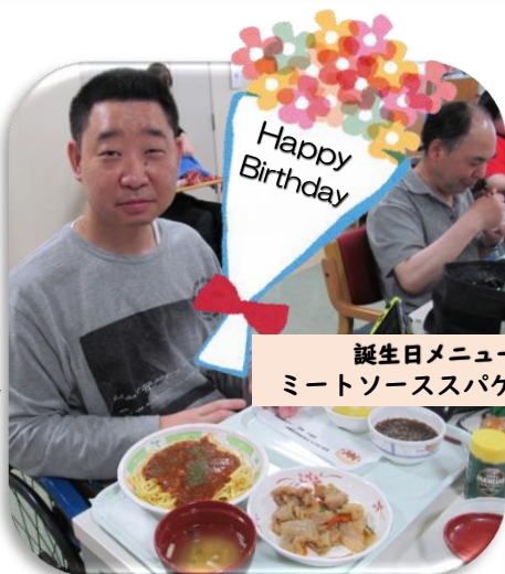
誕生日メニュー ミートソーススパゲッティ

誕生月には、利用者さんにお好きなメニューを伺い、誕生日メニューを召し上がっていただいています。利用者さん、ご家族様に、大変ご好評をいただいております！