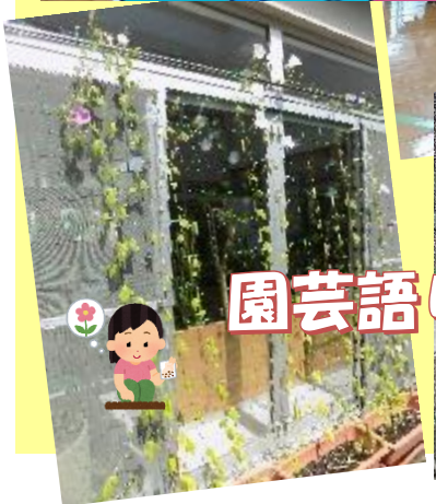
園芸語り部クラブ