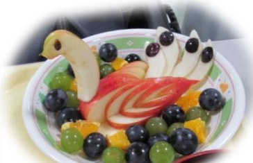
誕生日メニュー フルーツの盛り合わせ

誕生月には、利用者さんにお好きなメニューを伺い、誕生日メニューを召し上がっていただいています。利用者さん、ご家族様に、大変ご好評をいただいております！